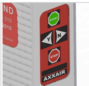
Tastierino di comando remoto