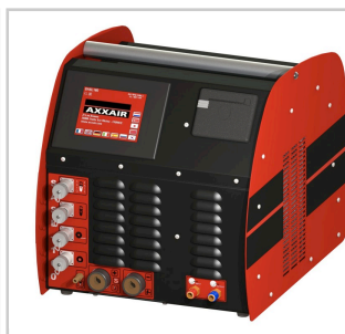
Commando de Stazione AXXAIR ( cf Tabella compatibilità Stazioni/teste-accessori )